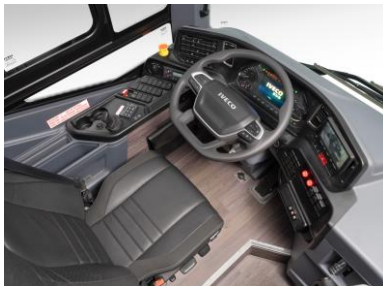
Tableau de bord fixe type CAR