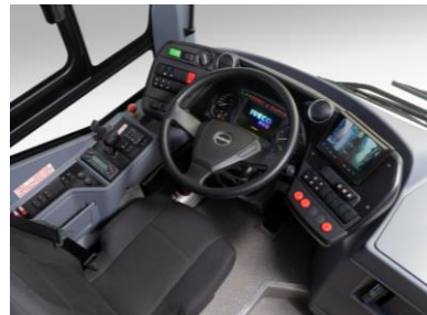
Tableau de bord mobile type BUS